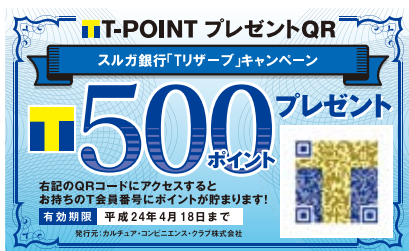
※サンプルイメージです。