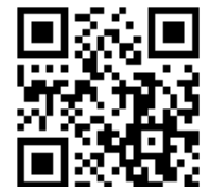
一般に利用される QRコード

また一般に利用されるQRコードは誰にでも容易に制作できてしまいますので、なりすまし対策としても最適です。