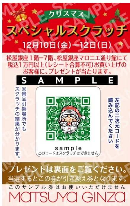
「松屋銀座 クリスマス スペシャルスクラッチ」くじ券とアニメーションイメージ